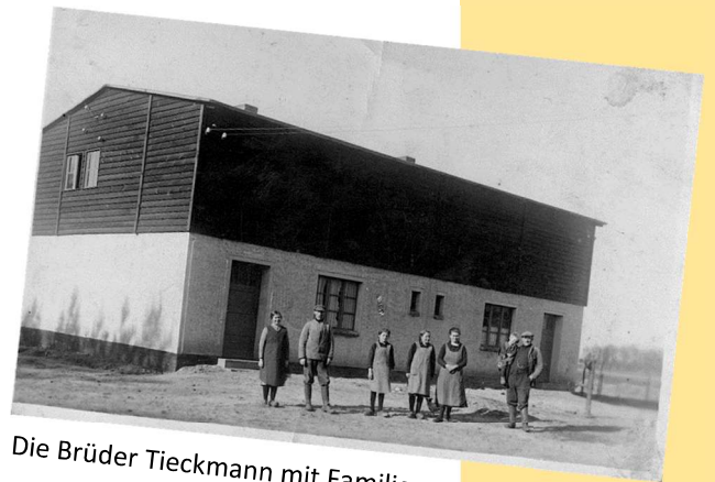
Die Brüder Tieckmann mit Familien