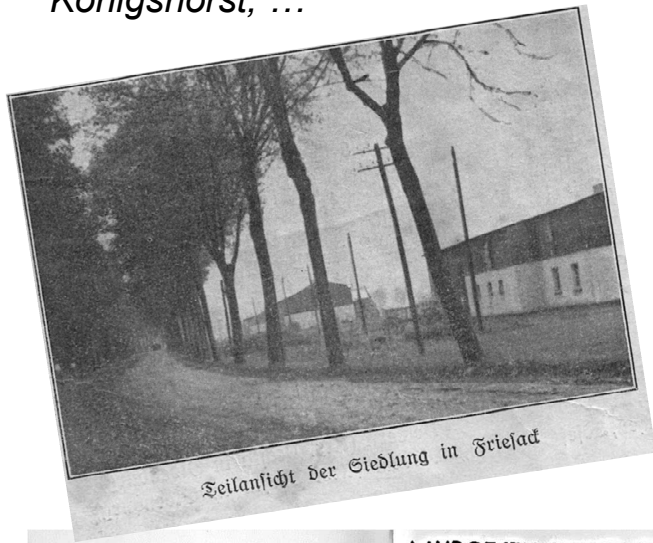
Seitansticht der Siedlung in Friesack